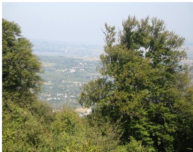
Rezervația paleontologică Băiceni