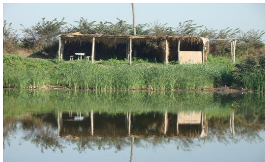
Rezervația Prutețul Bălătău