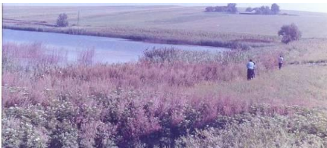
Turbăria de la Dersca