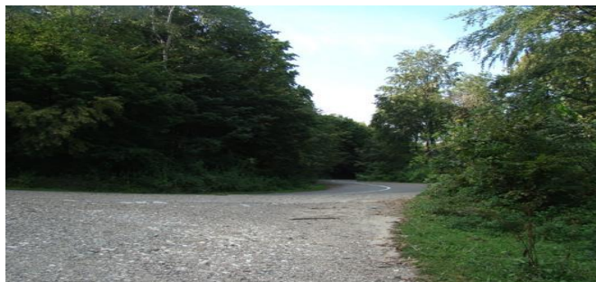
Rezervația forestieră Pădurea Uricani