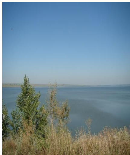
Complexul Stânca Costești