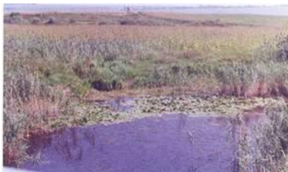
Imagini din rezervația Bălțile Siretului